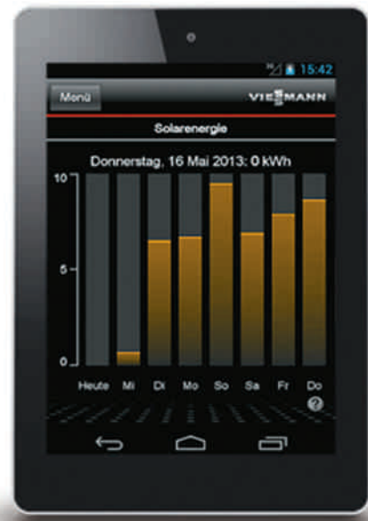
En combinaison avec une installation solaire, le gain en énergie solaire s'affiche sous forme d'histogramme (sur tablette PC)