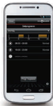
Programmation et affichage des plages horaires de fonctionnement (sur Android)