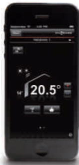
Page d'accueil avec réglage direct de la température ambiante (sur iOS)