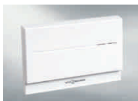
Module de communication Vitocom 100 (type LAN1)

Un menu dédié permet la sélection de la température de l'eau sanitaire. Activer/désactiver la préparation de l'eau chaude sanitaire et la pompe de bouclage est également réalisable.